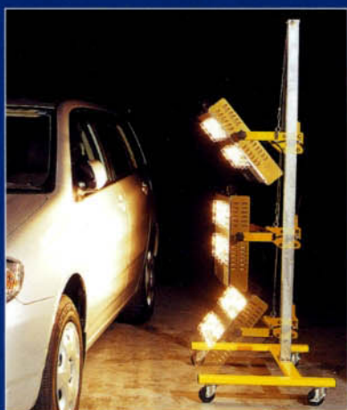
ボディー形状に合わせた照射が可能です。 (写真はイメージです)